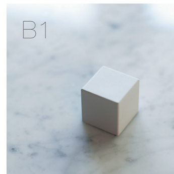
美しいエッジのミニマルデザイン。きりっと洗練された空間にフィット。