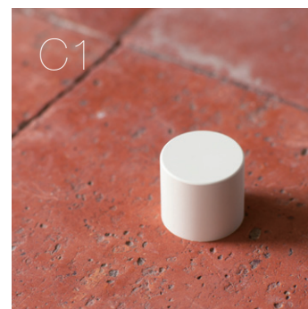
ミニマルだけど、やさしいフォルム。空間を選ばない汎用的なデザイン。